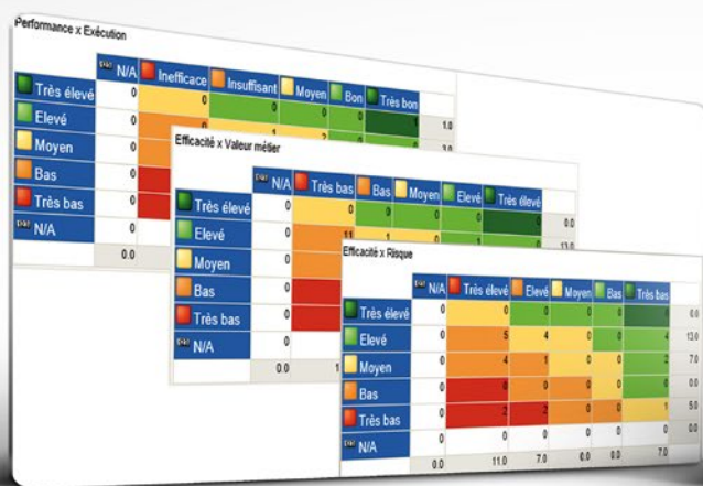
Heat Map des capacités métiers